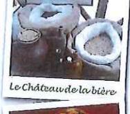
Le Château de la bière

Petite pause dans le restaurant du village (possibilité de manger en terrasse l'été). Formule tout compris à 15€90 : Entrée, plat, dessert, 1/4 de vin, café.