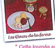
Les Glaces de la ferme

Visitez la brasserie et découvrez la fabrication des bières artisanales de Lonlay. Gratuit