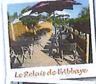
Le Relais de l'Abbaye

Accompagnés d'un guide de l'office de tourisme, découvrez le décor intérieur exceptionnel de l'abbatiale. 3€ - Gratuits enfants