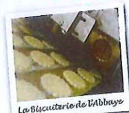
La Biscuiterie de l'Abbaye